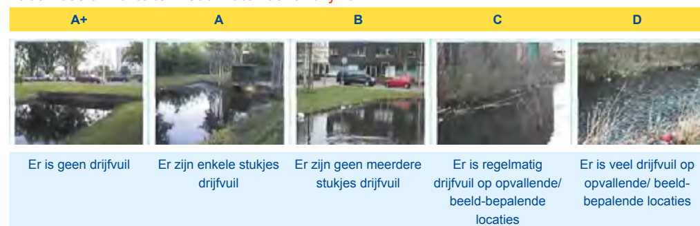
Tabel: beeldkwaliteitsniveau water-oever-drijfvuil

De gemeente is verantwoordelijk voor de beschoeiingen langs de waterkanten (voor zover dat niet privaatrechtelijk met derden is geregeld).